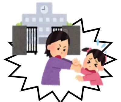
学校行きたくない