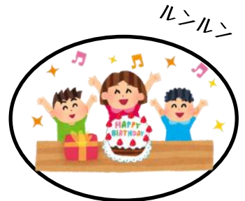
誕生日だよ うれしいよ